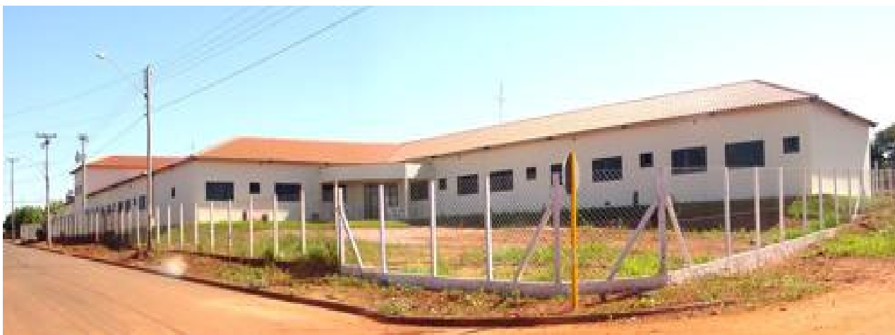
Casa Santa Madre Paulina